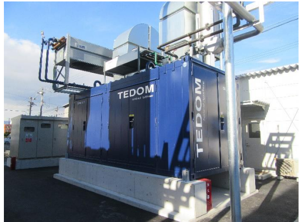
ガスエンジン発電機