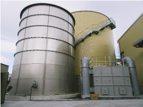
メタン発酵槽と二次発酵槽

2023年1月19日に石井登志郎西宮市長をはじめ、関係者の皆様にご臨席いただき、竣工式を執り行いました。